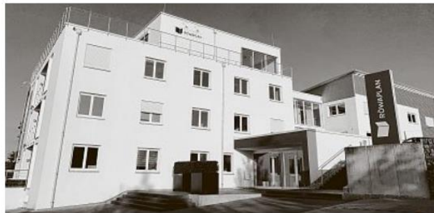
Das Hauptgebäude der RÖWAPLAN AG in Abtsgmünd.

Auch inhaltlich hat sich RÖWAPLAN weiterentwickelt. Es bestand die Notwendigkeit, den Kunden ganzheitliche Lösungen anzubieten. Heute ist es nicht mehr ausreichend, nur